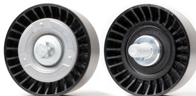
Figura 2: versión nueva

¡Observar las indicaciones del fabricante del vehículo!