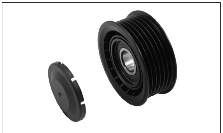
Figura 1: Modelo 1

La principal diferencia es el revestimiento delantero y la arandela adicional en el modelo de la figura 2. En este modelo, para que pueda alinearse la polea acanalada, debe montarse obligatoriamente la arandela suministrada entre el bloque de motor y la polea de inversión.