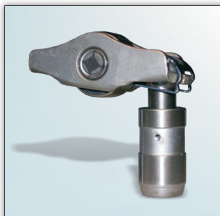
Fig. 1: Modelo 1