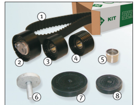
Fig. 2: Contenido del KIT 530 0342 10

Encontrará los recambios correspondientes en nuestro catálogo on-line en www.schaeffler-aftermarket.es o en www.rexpert.com .